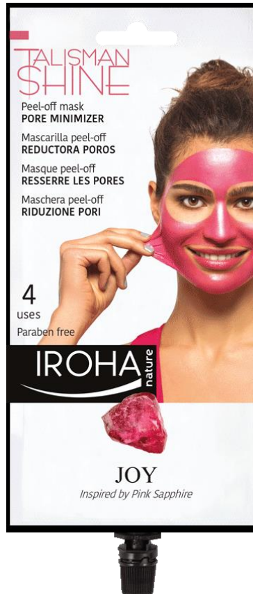
Peel off mask POREN-MINIMIEREND