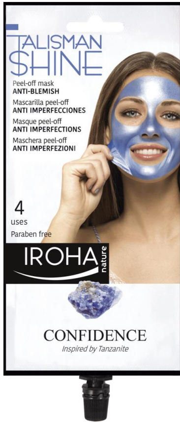
Peel off mask ANTI-IMPERFEKTIONEN