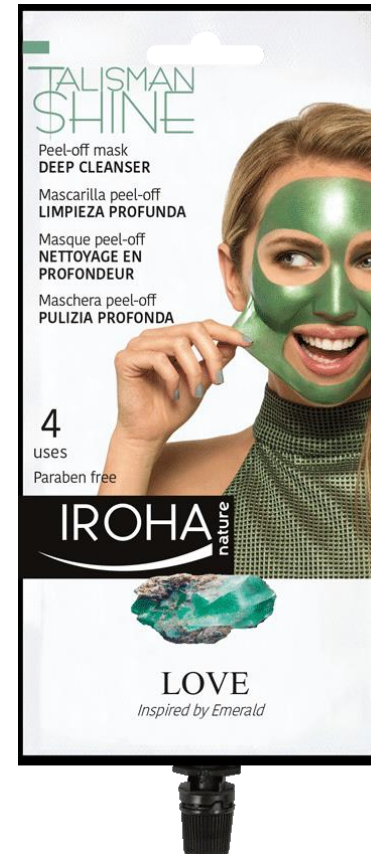
Peel off mask TIEFENREINIGER